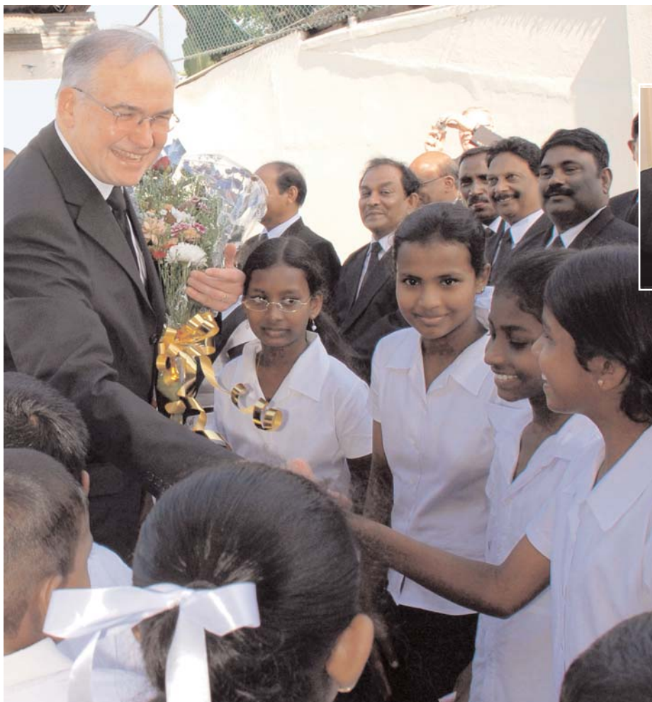
Zdjęcie duże: Wielka radość panowała wśród braci i siostrz z okazji wizyty Głównego Apostoła