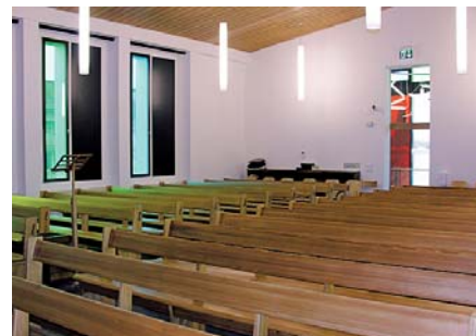
Wnętrze odnowionego kościoła

Po remoncie kościoła zboru Lenzburg-Staufen, 6 grudnia 2009 roku, ponownie zebrano się na nabożeństwo wyświęcające, które apostoł Heinz Lang przeprowadził słowem biblijnym z 1. Mojżeszowej 28, 17. Dziewięć miesięcy trwała przebudowa kościoła z 1960 roku. Do obiektu sakralnego zostało dobudowane wejście z różnokolorowego szkła, które dzięki temu jest bardzo zapraszające. W wyniku zmiany wymiarów okien i wstawienia kolorowych szyb większy charakter sakralny zyskało też wnętrze kościoła. Nowością jest też instalacja solar na dachu, który z powodu swoich spadów nadaje się do wykorzystania tej technologii energii odnawialnej. Kościół teraz spełnia standardy do uzyskania certyfikatu energooszczędnego obiektu budowlanego.