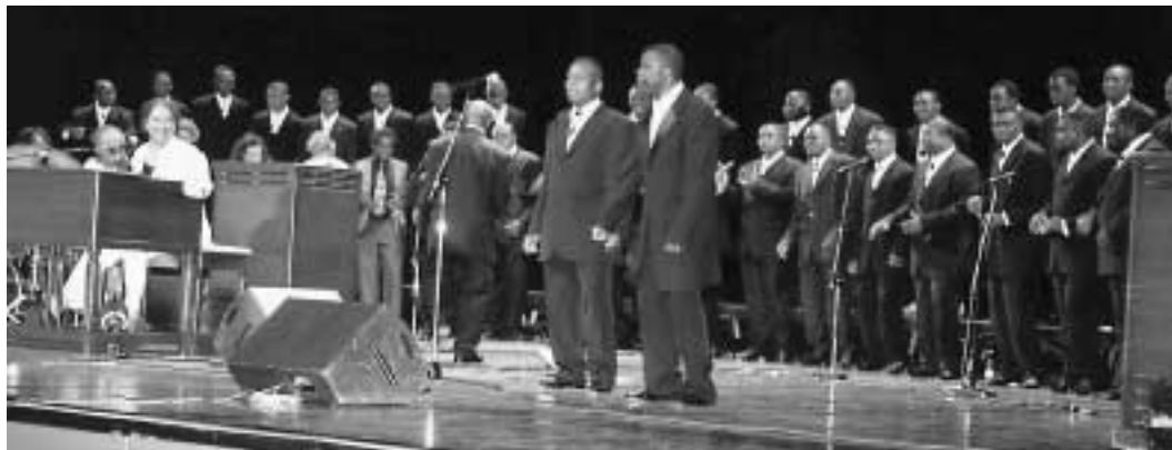
Koncert gospel w Evreux

Na koncert przybyło ponad 700 słuchaczy.