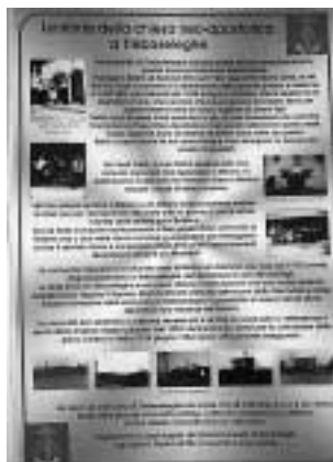
Tablice informacyjne przedstawiały dzieło Boże i historię zboru Trebaseleghe

Włochy: Bracia i siostry zboru Trebaseleghe korzystając z okazji popularnego dorocznego festynu, odbywającego się na placu w pobliżu kościoła, zorganizowali Dzień Otwarty. Spośród 140 przybyłych gości około 130 wykazało takie zainteresowanie nauką Kościoła Nowoapostolskiego, że prowadzili ożywione rozmowy z braćmi i siostrami ze zboru i jakby całkowicie zapomnieli o festynie, na który zasadniczo przyszli.