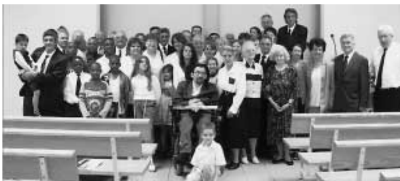
Bracia i siostry zboru Bordeaux