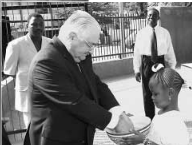
Woda do umycia rąk po przybyciu do kościoła w Niameju